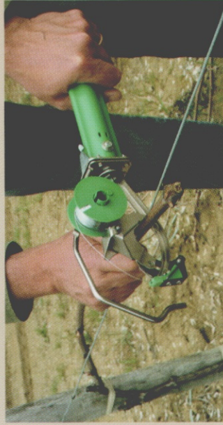
1 - POUSSER

Faire les mouvements sans brusquerie, en allant simplement en butée.