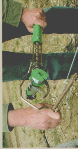
3 - LEVER

Depuis la position tirée à fond, (photo 2) lever la tête pour dégager la lieuse avec un mouvement du poignet, comme pour une canne à pêche...! La tête est alors rappelée par le ressort (photo 3) et se trouve prête pour le prochain lien.