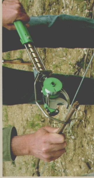
2 - TIRER